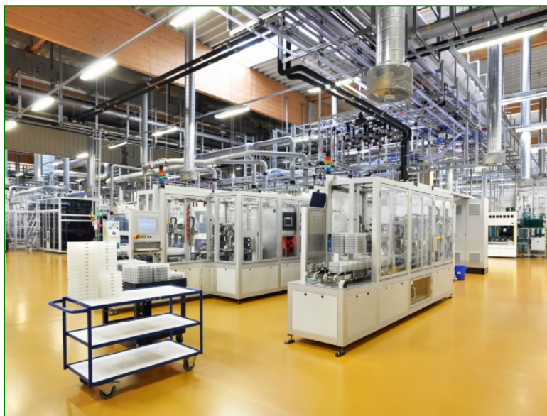
Montagebeispiel (Seilsystem im Lieferumfang)

Weitere Modelle und Ausführungen bitte projektbezogen anfragen.